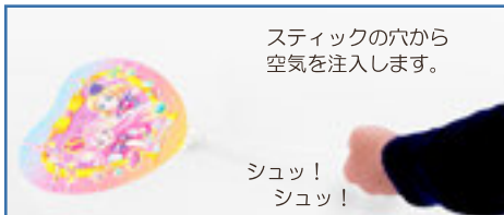
ブローイングタイプ(吹き込み)イメージ

風船がフラット(膨らんでいない)状態で納品されます。納品後にポンプ等で膨らましていただきます。ロットが少ない、在庫スペースを取らない、などのメリットがあります。萎んでも追加の空気注入が可能です。