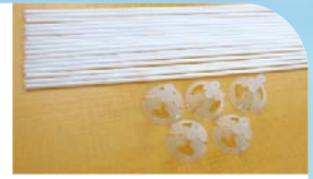
マキシカップ&スティック (60cm)